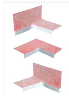
WESKO Multi-Dichtecken Art.-Nr. 50.095.040